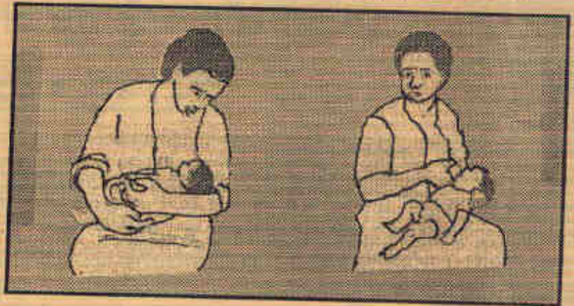
ਠੀਕ ਸਥਿਤੀ (ਏ)